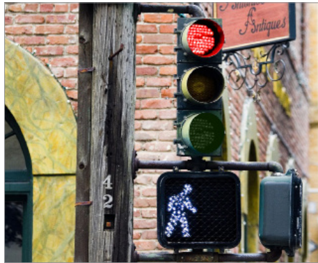
Pagpapahusay sa mga signal at pagbabago sa bilis ng pagpapalit ng ilaw