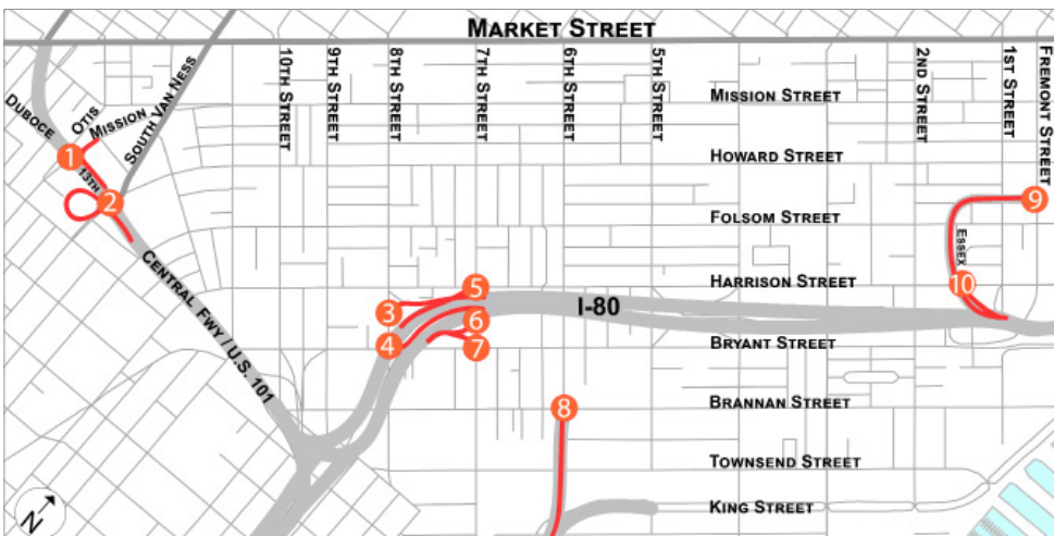
— Naitatambal ang mga rampa at interseksiyon sa proyektong pag-aaral sa mga bagay na nakalista sa table na nasa ibaba:

Pinamunuan ng Transportation Authority ang nakaraang pag-aaral ukol sa pagpapahusay ng interseksiyon sa rampa noong 2016–2017, kung saan nagmungkahi kami ng mga pagpapahusay sa kaligtasan para sa limang interseksiyon sa rampa ng freeway sa SoMa. Ginagawa namin ngayon ang ikalawang pag-aaral kasama ang SFMTA upang matukoy ang mga paraan para mapahusay ang kaligtasan para sa lahat ng nagbibiyaha sa mga sumusunod na interseksiyon: