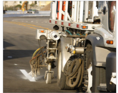
Pagmamarka o striping sa daraanan at interseksiyon

Posibleng kasama sa mga halimbawa ng pagpapahusay ang ekstensiyon ng bangketa, pagpapahusay sa signal, pagpapaganda sa tawiran, pagpapahusay sa pagmamarka, pagkakaroon ng bagong -konfigurasyon sa rampa, pagbabago sa bilang ng daanan sa kalye upang mapakalma ang trapiko, o iba pang ideya na lilitaw sa kabuuan ng proseso ng pag-aaral. Intensiyon naming makagawa ng pinagsama-samang iba't ibang pagpapahusay na matatapos sa maikling panahon at puwede nang maging handa sa susunod na ilang taon, at ilang mas malalaking ideya na posibleng mas matagal ang pagpapalano at pagpapatupad.