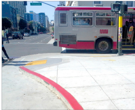
Mga bulb-out o ekstensiyon ng bangketa